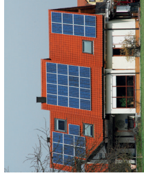
Photovoltaik bedeutet Unabhängigkeit vom Energieversorger