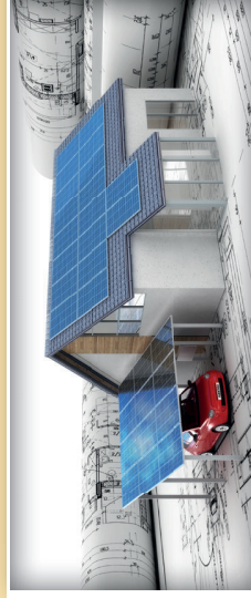
Der eigene Strom aus der Sonne!

Oder besuchen Sie unsere Ausstellung im Foyer des Rathauses während der Öffnungszeiten.