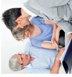
Eine unabhängige Solarberatung ist der 1. Schritt