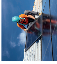
Installateure sind im Solardachkatalog hinterlegt