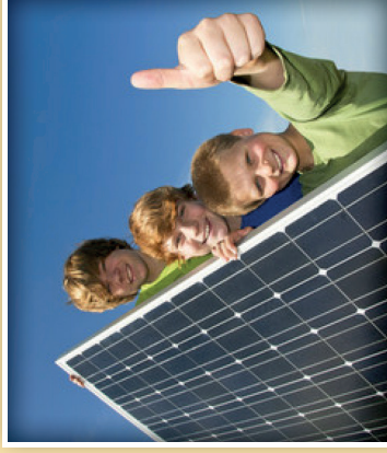
Für unsere Zukunft

Wichtig ist, sich über alle Ihre Möglichkeiten vorab zu informieren!