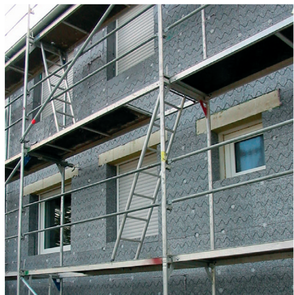
Polystyrolämmung mit Sturzschutz

Wärmedämmverbundsysteme mit Mineralwolle sind im eingebauten Zustand nicht brennbar (Baustoffklasse A*). Systeme mit Polystyrol-Hartschaum können die Baustoffklasse B1 (Schwerentflammbar) erreichen, wenn zusätzliche Brandschutzmaßnahmen getroffen werden. Dafür müssen im Sockelbrandbereich (von Geländeoberkante bis etwa 12 m Höhe) und beim Anschluss an brennbare Dächer mehrere umlaufende Brandriegel eingebaut werden. Dabei handelt es sich um Streifen aus nicht brennbarer Mineralwolle mit einer Höhe von mindestens 20 cm. Bei einer Dämmdicke von mehr als 10 cm muss, je nach Gebäudehöhe, zusätzlich ein Brandriegel oder ein Sturzschutz über den Fenstern eingebaut werden. Vorhandene Brandwände müssen in jedem Fall mit nicht brennbarem Material gedämmt werden.