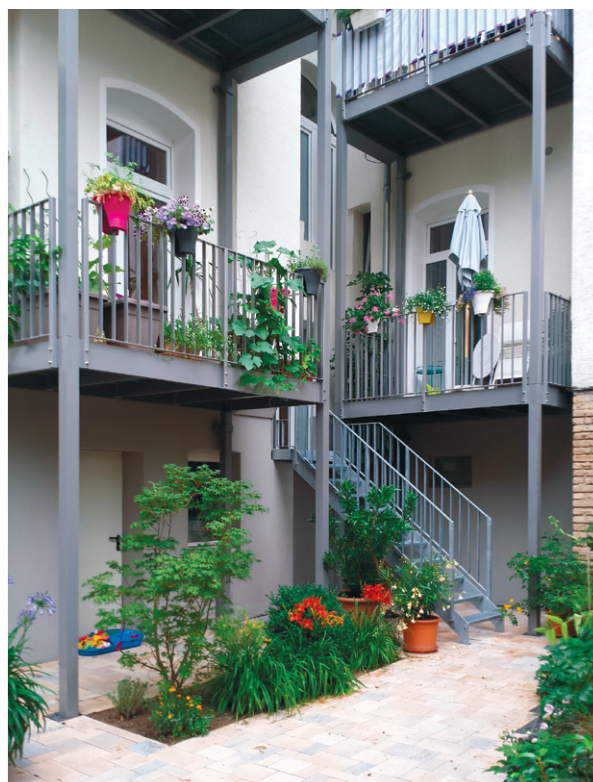
Thermisch getrennte Balkonkonstruktion

Durchgehende Kragplatten aus Beton, wie Balkonplatten oder massive Vordächer, stellen eine deutliche Wärmebrücke dar. Optimal wäre ein Abbruch – falls dies keine Statikprobleme verursacht – und ein Neuaufbau mit einer thermisch getrennten Konstruktion. Der neue Balkon steht dann auf Stützen vor der gedämmten Fassade