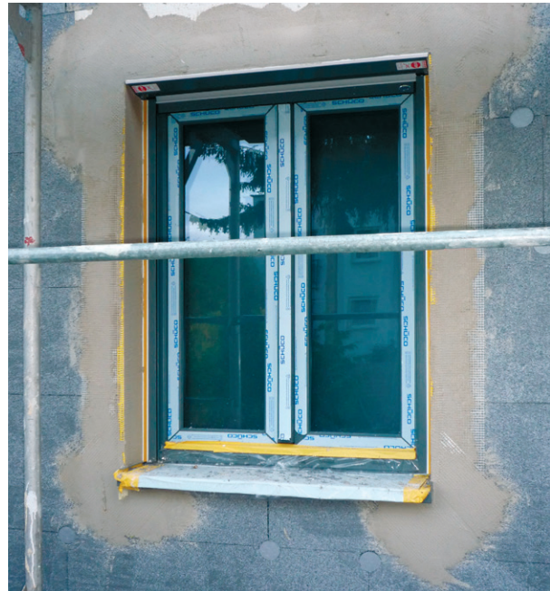
Armierungsgewebe im Fensterbereich

An allen Außenecken sollten Gewebewinkel oder Kantenschutzprofile angebracht werden. Sie dienen zur Verstärkung der Ecken gegen Beschädigungen und erleichtern die Ausbildung einer exakten Kante. Zusätzlich werden an den Ecken von Fenstern und Türen Diagonallstreifen aus Armierungsgewebe angebracht.