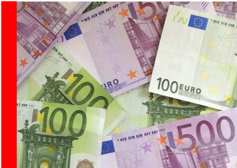
Bund und Land fördern Ihre energetische Sanierung durch Zuschüsse oder zinsgünstige Darlehen.

Aktuelle Förderinfos finden Sie auf der Internetseite von ALTBAUNEU. Noch besser: Sie beauftragen Ihr Energieberatungsbüro mit der Zusammenstellung der lukrativsten Programme für Ihre energetische Sanierung.