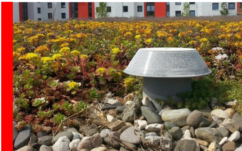
Eine Dachbegrünung hält bei Starkregen Wasser zurück und sorgt bei Hitze für Temperatenausgleich.

Wichtig ist bei den Umbauten, die aufgrund des Klimawandels durchgeführt werden, Energieeffizienzmaßnahmen bereits mit zu bedenken: Eine Flachdachbegrünung zur Wasserrückhaltung und Verbesserung des Mikroklimas im Sommer sollte unbedingt mit einer optimalen Wärmedämmung des Daches für den Winter einhergehen.