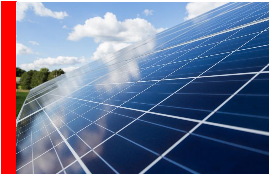
Mit einer Photovoltaik-Anlage machen Sie sich unabhängig von steigenden Strompreisen und schützen die Umwelt

Aber auch wenn die Sonne nicht scheint, können Sie mit einem Stromspeicher Ihren Sonnenstrom rund um die Uhr verwenden. Die Technik ist heute zuverlässig und bezahlbar. Und – Sie machen sich unabhängiger von Strompreiserhöhungen. Sind Photovoltaik-Anlage und Speicher einmal bezahlt, ist der Strom vom Dach kostenlos.