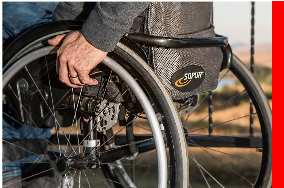
Kombinieren Sie anstehende Umbauten mit einer energetischen Sanierung

Für Umbaumaßnahmen im Bereich Abbau von Barrieren und Verbesserung des Einbruchschutzes sowie Energieeffizientes Sanieren stehen Förderprogramme von der KfW ( www.kfw.de ) und der NRW-Bank ( www.nrwbank.de ) zur Verfügung.