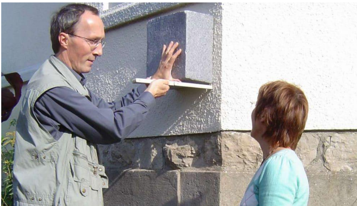
Energieberater prüfen den Zustand Ihres Gebäudes und erstellen einen individuellen Sanierungsplan, Niedrig-Energie-Institut, Detmold

Aufbauend auf dieser Analyse werden optimal ineinandergreifende Sanierungsschritte empfohlen; sozusagen ein ganz individueller Sanierungsfahrplan für Ihr Zuhause. Wenn Sie nicht alle Empfehlungen sofort umsetzen wollen, so zeigt Ihnen die Energieberatung, in welcher Reihenfolge Sie die energetische Modernisierung angehen sollten und welche Energieeinsparpotenziale möglich sind. Dabei werden sowohl Ihre familiäre Situation und die zukünftige Nutzung Ihres Hauses bedacht, als auch Ihre weiteren Wünsche und Anforderungen und nicht zuletzt Ihre finanziellen Möglichkeiten.