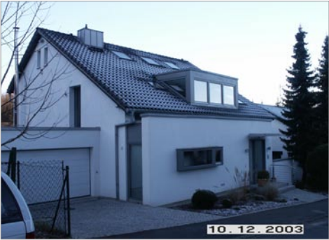
10. 12. 2003 SANIERT

Das 1963 errichtete Einfamilienhaus in Dortmund-Kirchhörde wurde ab 2000 gründlich saniert. Das ganze Gebäude erhielt einen Vollwärmeschutz vom Dach bis zum Keller. Die Dachsparren wurden auf 22 cm aufgedoppelt und mit 18 cm Mineralwolle gedämmt, ebenso wurde der ungedämmte Spitzboden gedämmt und zum Wohnraum ausgebaut. Die veraltete Ölheizung (nur fürs Heizen des Gebäudes zuständig) wurde durch eine effiziente Brennwerttherme mit 24 KW-Leistung ausgetauscht. Diese übernimmt jetzt die Erwärmung des Heiz- und Brauchwassers. Eine 7,8 m 2 große Kollektoranlage unterstützt die Therme. Auch wurde ein 400 l Speicher eingebaut. Neben den Energiesparmaßnahmen wurde auch eine Regenwassernutzungsanlage installiert, die von den Dachflächen gespeist wird. Sie versorgt Toiletten und Waschmaschine und dient zur Gartenbewässerung.